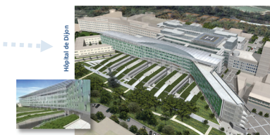
Hôpital de Dijon