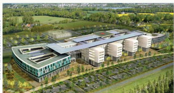
Hôpital de Saint Nazaire