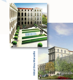
Hôtel Dieu Marseille