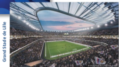
Grand Stade de Lille